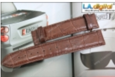
DÃçy da Tissot (MS-D02) 180.000 Vnd

dÃçy da Ä‘á»“ng há»“ Tissot [Xem chi tiáº;t...]