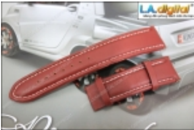
DÃçy da Breitling (MS-D03) 180.000 Vnd

dÃçy da Ä'á»“ng há»“,day da cÃj sáºu [Xem chi tiáº;t...]