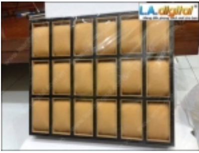
Khay trÆ°ng bã y 18 gá»'i (MS-K18) 490.000 Vnd

khay trÆ°ng bã y 18 gá»'i gá»— khá»'i cao cá»p [Xem chi tiá»t...]