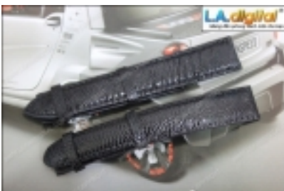
Dãy da 'á'ng há»" (MS-D16) 250.000 Vnd

dãy da cá sấu, dãy da 'á'ng há»" [Xem chi tiết...]