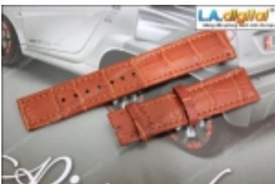
Dãçy da IWC (MS-D04) 180.000 Vnd