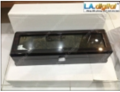
Há»™p trÆ°ng bÃ y 6 gá»'i (MS-GV6) 430.000.000 Vnd

Ả•á»“ng há»“, Tag Heuer [Xem chi tiá»¿t...]