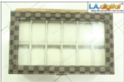
Há»™p trÆ°ng bã y Ä‘á»“ng há»“(MS-T01) 200.000 Vnd

DÃçy da Vacheron constatin [Xem chi tiáº;t...]