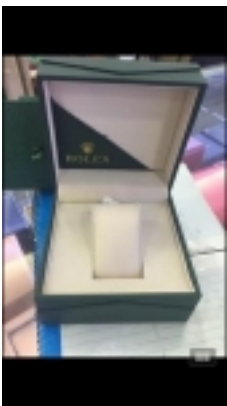
Há»™p Rolex full box(MS-RL4) 175.000 Vnd

Há»P Lá®C (Há»P LÃŠN DÃ,Y CÃ“T) CHO Ä•á»'NG Há»' AUTOMATIC(MS-MQ1), GÃ-a trÃªn chÆ°a bao gá»m vá°n chuyá»fn ngoÃ i ná»™i thÃ nh, [Xem chi tiá°¿t...]