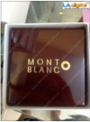
Hộp Montblanc (MS-MB2) 100.000 Vnd

Hộp Montblanc (MS-MB2) [Xem chi tiết...]