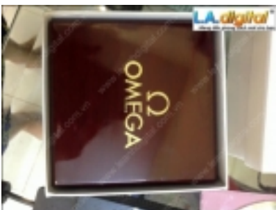
Há»™p Omega( MS-OM4) 100.000 Vnd