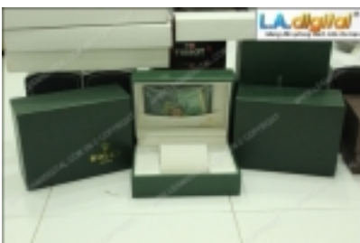
Há»™p Rolex (MS-H2) 350.000 Vnd

Dãçy da Ä'Ä Ä'ia»fu ,dãçy da Ä'á»“ng há»“ [Xem chi tiá»t...]