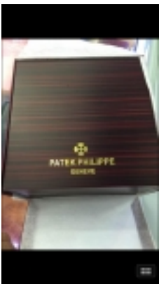
Há»™p full box Patek Philippe(MS_PT02) 300.000 Vnd

Há»™p full box Patek Philippe [Xem chi tiá»¿t...]