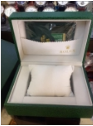
HÃ ıp Rolex (MS-RL3) 200.000 Vnd

HÃ ıp Rolex (MS-RL3) [Xem chi tiáº¿t...]