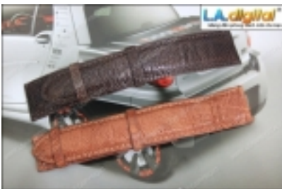
Dãçy da Ä'Ä Ä'ia»fu (MS-D20) 250.000 Vnd

Dãçy da Ä'Ä Ä'ia»fu ,dãçy da Ä'á»“ng há»“ [Xem chi tiá»t...]