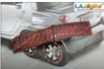
DÃçy da cÃ; sÃçu (MS-D21) 250.000 Vnd

dÃçy da Ä‘á»“ng há»“ Tissot [Xem chi tiáº; t...]