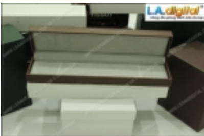
Há»™p Ä‘á‘ng há»™“(MS_T-03) 150.000 Vnd

Há»™p Vacheron Constatin [Xem chi tiáº;t...]