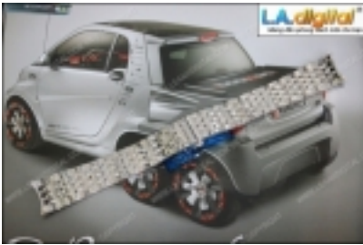
Dãy kim loại Tissot (MS-D12) 280.000 Vnd

Dãy kim loại; dãy 'á'ng há»" [Xem chi tiết...]