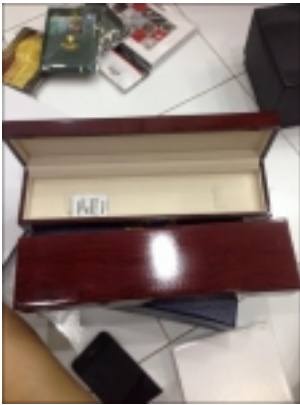
Há»™p gá»— dÃ i (MS-GD1) 120.000 Vnd

Há»™p gá»— dÃ i (MS-GD1) [Xem chi tiáº;t...]