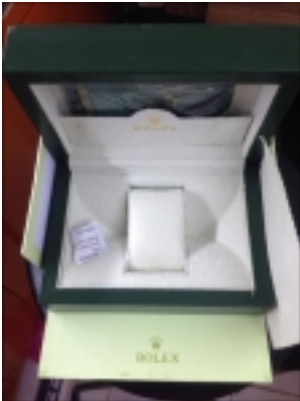
Há»™p Rolex full box(MS-RL2) 300.000 Vnd

Ả•á»“ng há»“, Tag Heuer [Xem chi tiá»¿t...]