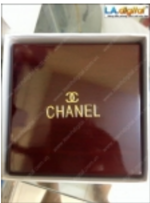
Hã'p Chanel (MS-CN1) 100.000 Vnd

há»™p Ä'á"ng há" montblanc loá°ji 2 [Xem chi tiá°;t...]