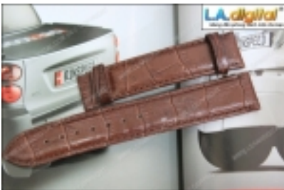
DÃçy da Tissot (MS-D02) 180.000 Vnd

dÃçy da Ä‘á»“ng há»“ Tissot [Xem chi tiáº; t...]