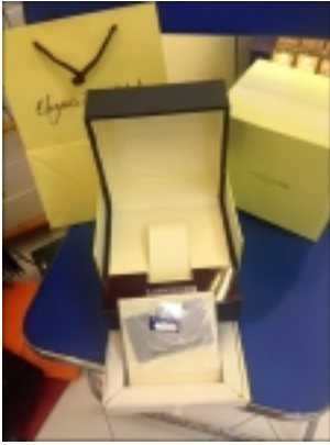
Há»™p full box Longines( MS-L01) 350.000 Vnd