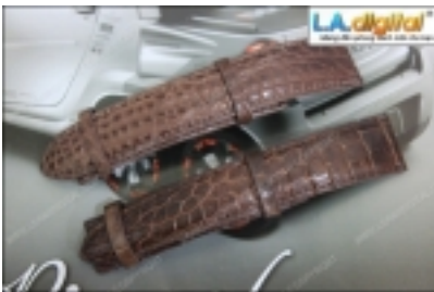
Dãy da cá sấu (MS-D19) 250.000 Vnd

dãy 'á'ng há»" ,Dãy kim loại Tissot [Xem chi tiết...]