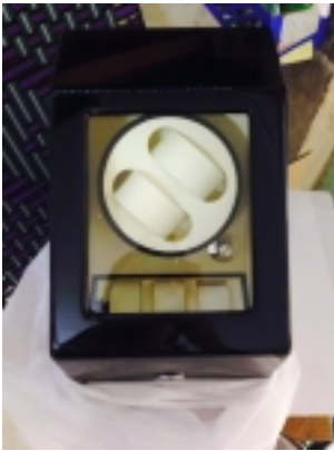
Há»P Lá®C -Há»P LÃŠN DÃ,Y CÃ“T(MS-MQ1) 1.960.000 Vnd

Há»P Lá®C (Há»P LÃŠN DÃ,Y CÃ“T) CHO Ä•á»'NG Há»' AUTOMATIC(MS-MQ1), GÃ-a trÃªn chÆ°a bao gá»m vá°n chuyá»fn ngoÃ i ná»™i thÃ nh, [Xem chi tiá°¿t...]