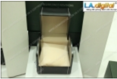
Há»™p Ä‘á»“ng há»“(MS_T-04) 150.000 Vnd

há»™p Ä‘á»“ng há»“( [Xem chi tiáº; t...]