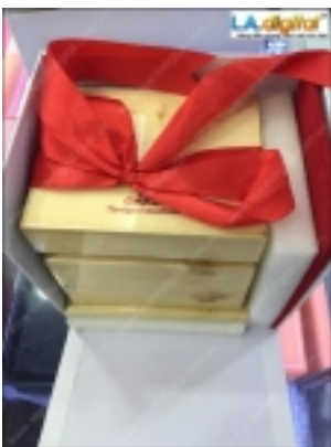
HÃ´p Omega Replica full box(MS-OM1) 480.000 Vnd

HÃ´p Omega Replica full box loáº;i 2 [Xem chi tiáº;t...]