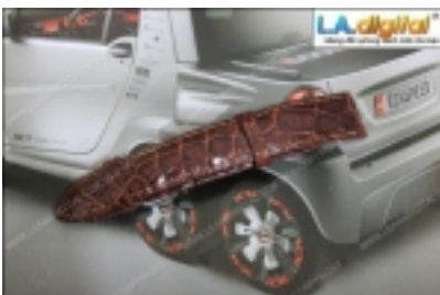
DÃçy da cÃj sÃçu (MS-D22) 250.000 Vnd

DÃçy da Ä'á»“ng há»“,DÃçy da IWC [Xem chi tiáº;t...]