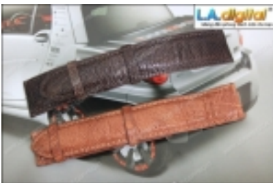
Dã»y da Ä Äiá»fu (MS-D20) 250.000 Vnd

Dã»y da Ä Äiá»fu ,dã»y da Äá»ng há» [Xem chi tiá»t...]