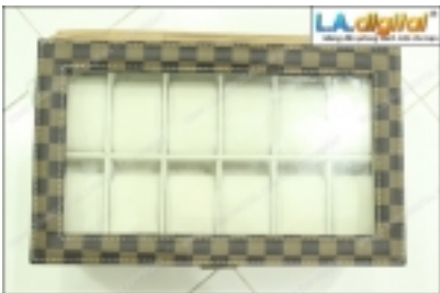
Há»™p trÆ°ng bã y Ä‘á»“ng há»“(MS-H01) 200.000 Vnd

DÃçy da Vacheron constatin [Xem chi tiáº;t...]