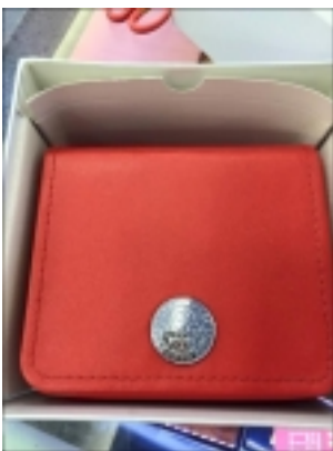
HÃ´p Omega Replica full box(MS-OM2) 300.000 Vnd

Há»™p gá»— dÃ i (MS-GD1) [Xem chi tiáº;t...]