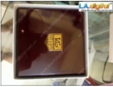
Há»™p Taghuere (MS-TG2) 100.000 Vnd