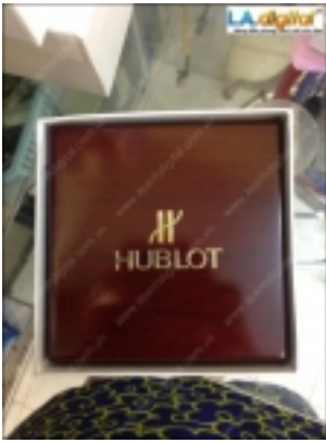
Há»™p Hublot (MS-HB3) 100.000 Vnd

Há»™p Hublot LOá° I 3 [Xem chi tiá°¿t...]