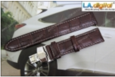
Dãçy da Longines (MS-D05) 200.000 Vnd