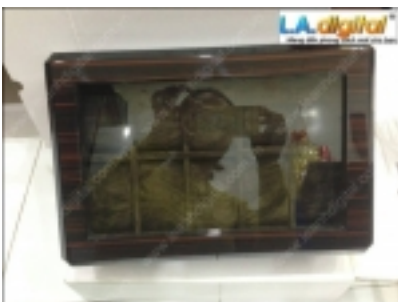
Hộp súng ống 10 gauge (MS-G10) 600.000 Vnd

Hộp súng ống 10 gauge (MS-G10) [Xem chi tiết...]