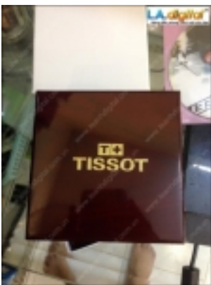
Há»™p Tissot(MS-TS2) 100.000 Vnd

HÃ ıp Rolex (MS-RL3) [Xem chi tiáº¿t...]