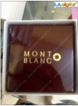
Hã'p Montblanc (MS-MB2) 100.000 Vnd

há»™p Ä'á"ng há" montblanc loá°ji 2 [Xem chi tiá°;t...]