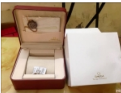
Há»™p full box Omega (MS-OM03) 240.000 Vnd