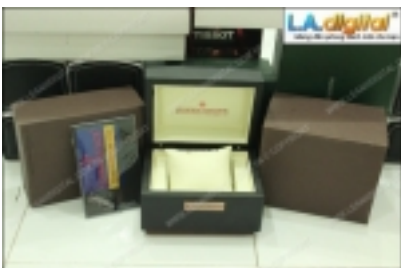
Há»™p Vacheron Constatin (MS-H3) 550.000 Vnd

há»™p Ä‘á»“ng há»“, HANH LÃ• Ä•Ãf QUA Sá»¬ Dá»«NG [Xem chi tiáº;t...]