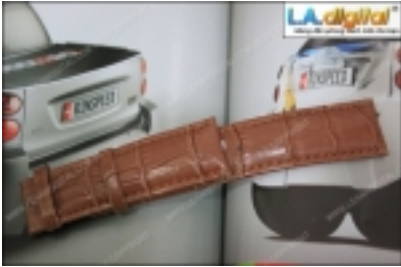
DÃçy da Vacheron constatin (MS-D08) 180.000 Vnd

DÃçy da Vacheron constatin [Xem chi tiáº;t...]