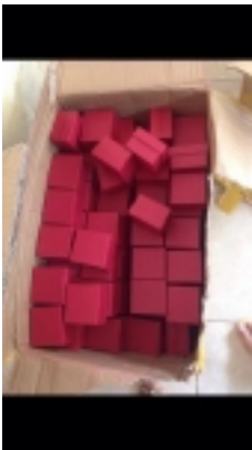
Há»™p giáº;y( MS-G01) 7.000 Vnd