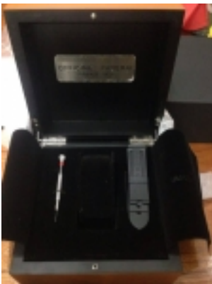
Há»™P Panerai Luminor (MS-PN01) 550.000 Vnd