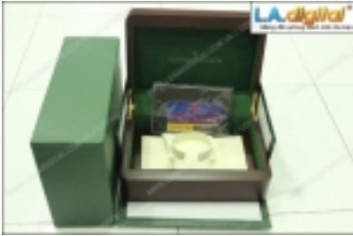
Há»™p Vacheron Constatin (MS-H1) 550.000 Vnd

Há»™p Vacheron Constatin [Xem chi tiáº;t...]