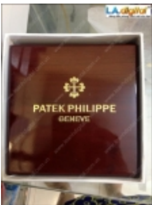
HÃ ıp Patek philippe(MS-PT5) 100.000 Vnd

Há»™p Tissot LOáº I 2 [Xem chi tiáº¿t...]