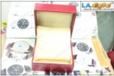
Há»™p Ä‘á»“ng há»“(MS-T01) 40.000 Vnd