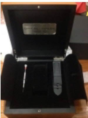
Há»™P Panerai Luminor (MS-PN01) 550.000 Vnd