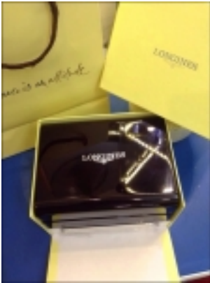
Há»™p replica Longines (MS-LG1) 400.000 Vnd

khay trÆ°ng bã y 18 gá»'i gá»— khá»'i cao cá»p [Xem chi tiá»t...]