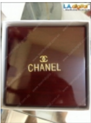
Hộp Chanel (MS-CN1) 100.000 Vnd

Hộp Montblanc (MS-MB2) [Xem chi tiết...]