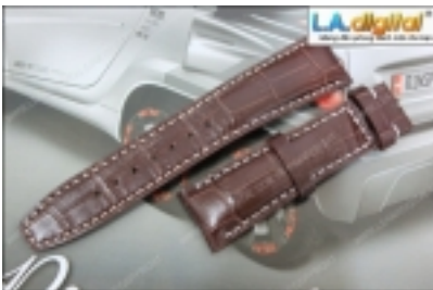
DÃçy da IWC (MS-D01) 180.000 Vnd

dÃçy Ä'á»“ng há»“, dÃçy da Breitling [Xem chi tiáº;t...]