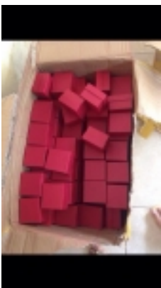
Há»™p giáº;y( MS-G01) 7.000 Vnd