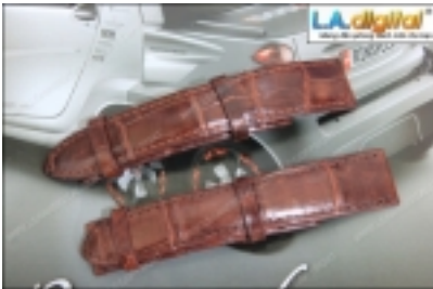
DÃçy da cÃj sÃçu (MS-D17) 250.000 Vnd

dÃçy da Ä'á»“ng há»“,day da cÃj sáºu [Xem chi tiáº;t...]