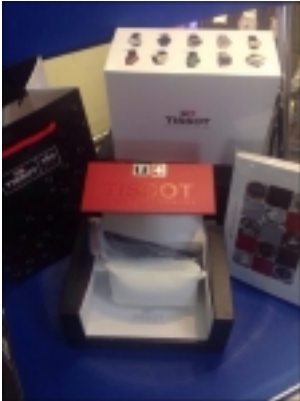
Há»™p Tissot (MS_H5) 280.000 Vnd

há»™p Ä‘á»“ng há»“( [Xem chi tiáº; t...]