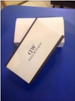
Há»™p replica DW(MS-DW1) 70.000 Vnd