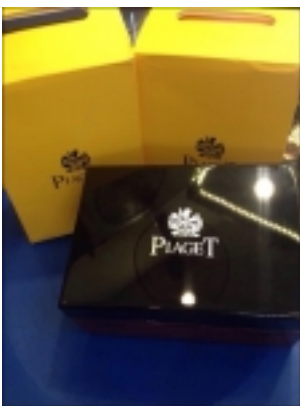
Há»™p replica Piaget(MS_PG1) 350.000 Vnd

Há»™p Hublot LOá° I 3 [Xem chi tiá°¿t...]