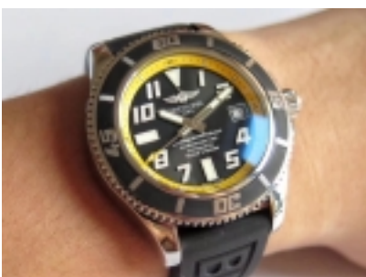
Breitling Superocean Ref.1736402/1