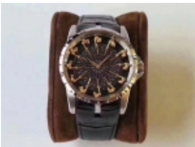
Roger Dubuis Excalibur Table Ronde Ref.26504