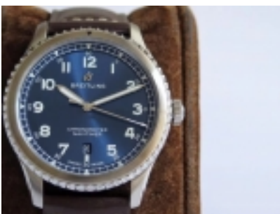
Breitling Navitimer 08 ZF.A17314101C1