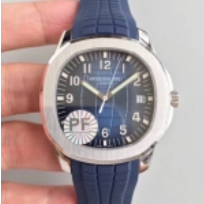
Patek Philippe Aquanaut Ref. 5168G-001