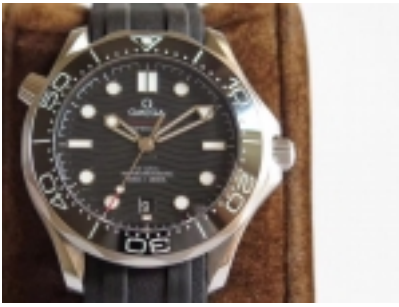
Omega Seamaster Diver 300M Ref.UR210.30