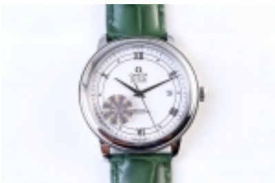
Omega De Ville Prestige Co-Axial Ref.424.13.40.