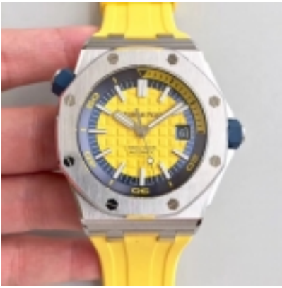
Audemars Piguet Royal Oak Offshore Ref.15710/2