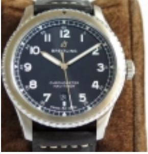
Breitling Navitimer 08 ZF.A17314101C2