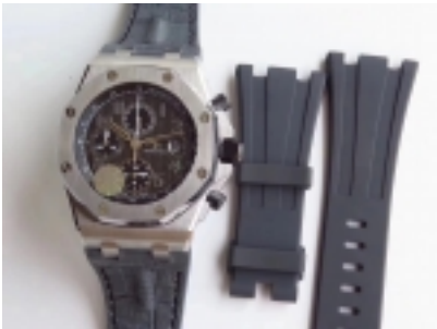
Audemars Piguet Royal Oak Ref.26400-9