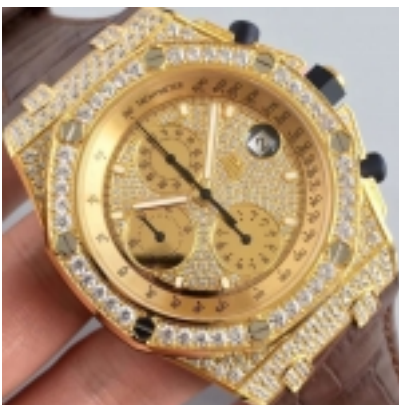
Audemars Piguet Royal Oak Offshore Ref. 26067