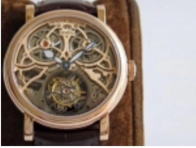
Franck Muller Giga Tourbillon Ref.7048 /1