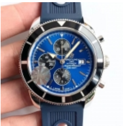
Breitling Superocean Heritage Chronograph OM./A1332024