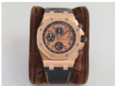
Audemars Piguet Royal Oak Offshore Ref.26470OR.1