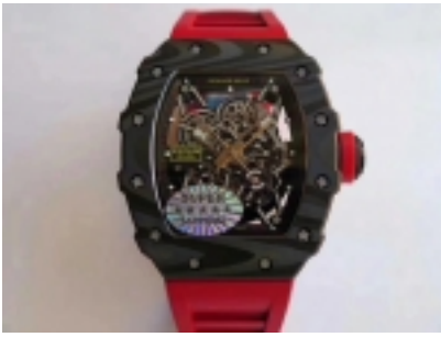
Richard Mille Rafael Nadal RM35-2