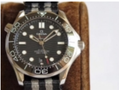
Omega Seamaster Diver 300M Ref.UR210.31