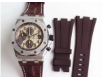
Audemars Piguet Royal Oak Ref.26400-8