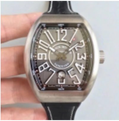
Franck Muller Vanguard Ref V45-1