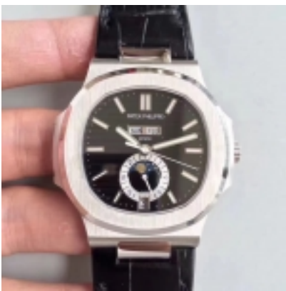
Patek Philippe Nautilus Ref.5726-01