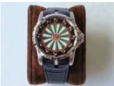
Roger Dubuis Excalibur Table Ronde Ref.26503