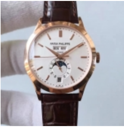
Patek Philippe Perpetual Calendar Ref.5740-1