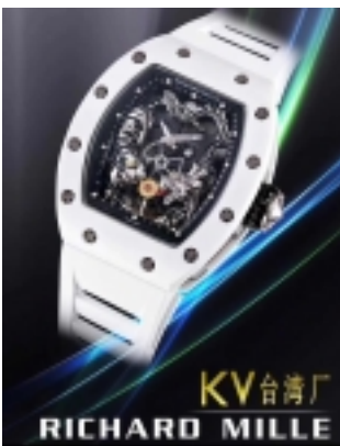
Richard Mille Tiger and Dragon Ref. RM051/1