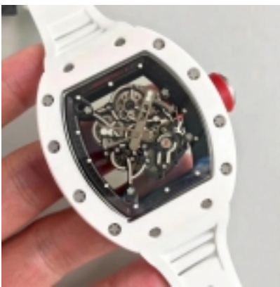
Richard Mille Bubba Watson RM55-1