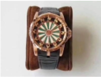
Roger Dubuis Excalibur Table Ronde Ref.26501