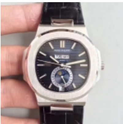
Patek Philippe Nautilus Ref.5726-02