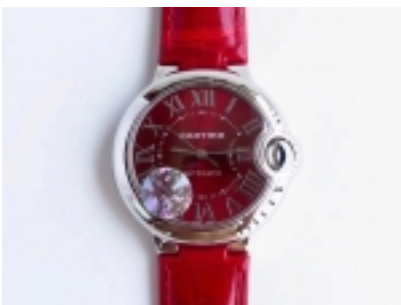
Cartier Ballon Bleu Ref.WSBB0022