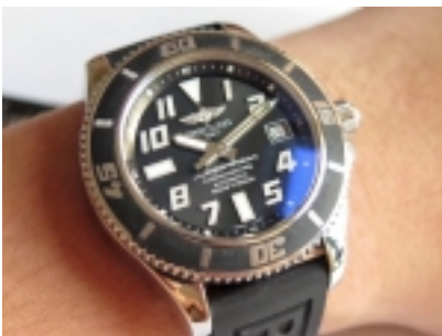
Breitling Superocean Ref.1736402/2