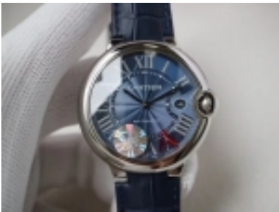
Ballon Bleu De Cartier Ref.W69012Z5