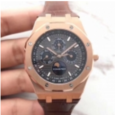
Audemar Piguet Royal Oak Ref.26575-2