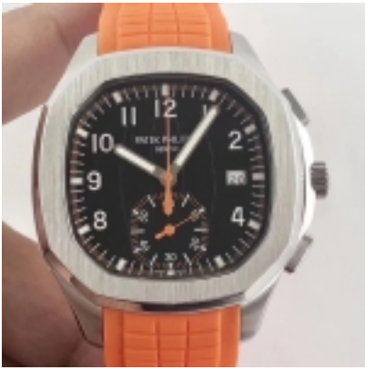
Patek Philippe Aquanaut Chronograph Ref.5968A