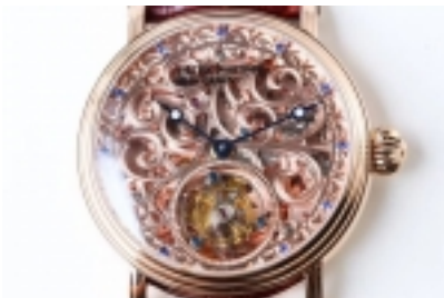
Patek Philippe Tourbillon Skeleton Ref.5608