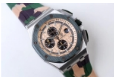
Audemars Piguet Royal Oak Offshore Chronograph Combat Ref.26400-