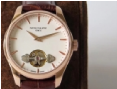
Patek Philippe Calatrava Erotic ML1