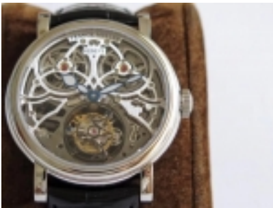
Franck Muller Giga Tourbillon Ref.7048 /2