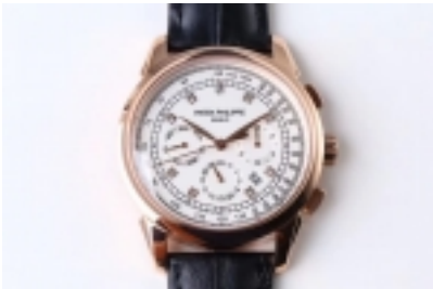
Patek Philippe Perpetual Calendar Chronograph Ref.5270