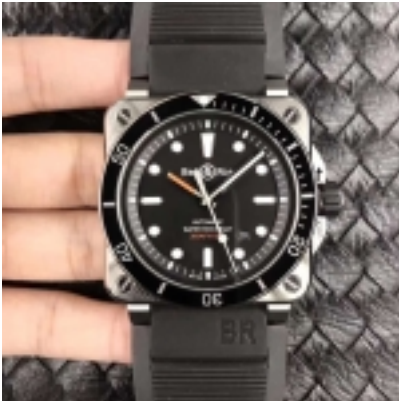
Bell & Ross BR 03-92 Diver