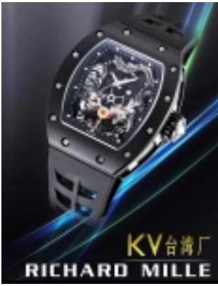
Richard Mille Tiger and Dragon Ref. RM051/2