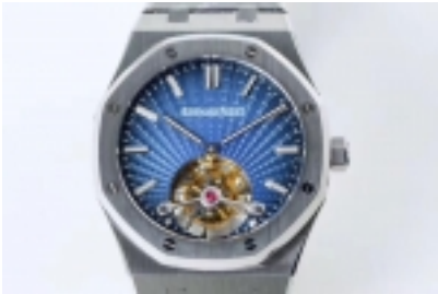
Audemars Piguet Royal Oak Tourbillon Ref. 26522