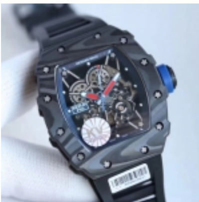
Richard Mille Rafael Nadal RM35-1