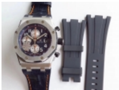
Audemar Piguet Royal Oak Ref.26400-7